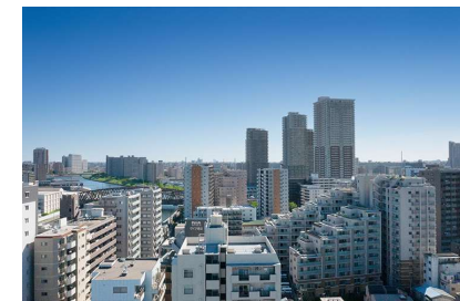
Aタイプ16階相当の眺望写真 (2023年10月撮影)