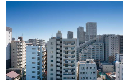
Aタイプ10階相当の眺望写真 (2023年10月撮影)