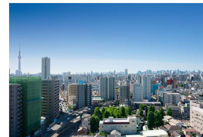
Bタイプ16階相当の眺望写真 (2023年10月撮影)