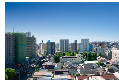
Bタイプ10階相当の眺望写真 (2023年10月撮影)